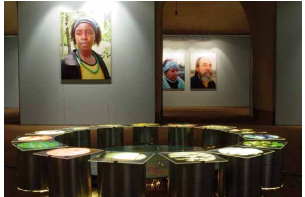
PROYECTO VIPAPRAES. Instalación de medidas variables. Rocca di San Giorgio. Orzinuovi (Italia)