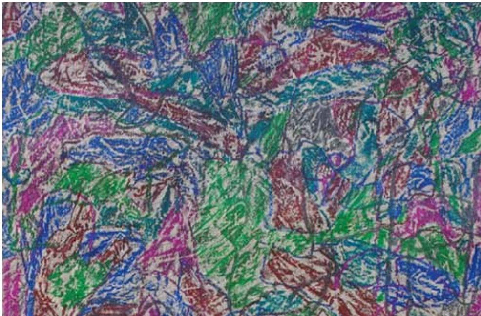
NATUR #59. (DETALLE)