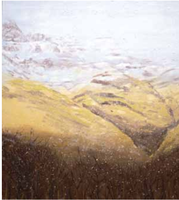
NEVADA EN EL CASTRO. Óleo, parafina y cera sobre lienzo. 100 x 100 cms.

Por eso, creo en el sentido más auténtico y profundo de este abastecimiento de ideas que el laboratorio santalbertese propone. Esto nos procura un inmenso placer, en un año como éste en que mi país celebra los 150 años de la Unidad Nacional. Y si esto poco interesa a los huéspedes, se trata, a pesar de todo, de una manera de reconocer el "hacer arte" el -"arbeit"-, como práctica de arte que está destinada a unir, precisamente, en virtud de las discrepancias y de las diferencias. Que además es capaz de provocar. La riqueza y la provocación de esta ocasión expositiva, nos invita a imaginar diferentes caminos suspendidos en el mismo umbral, participes de las