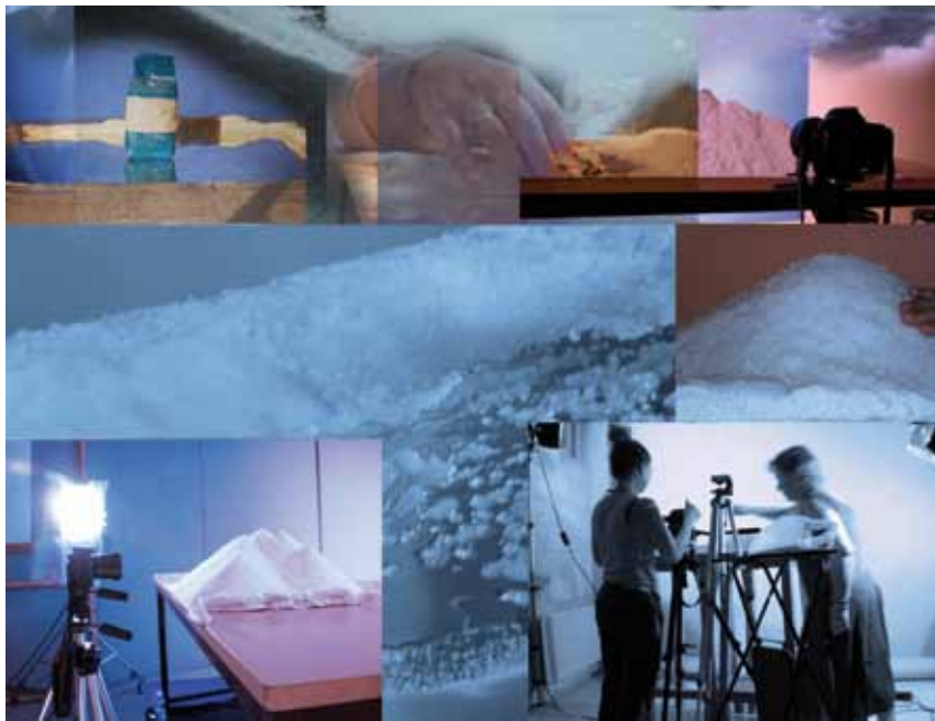
PROYECTO EHU 07/33. (DETALLE) Pagus disoluto. Vídeo animación.