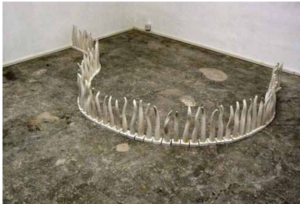
FILO D'ERBA. Terracotta bianca. 340 x 5 x 25 cms.