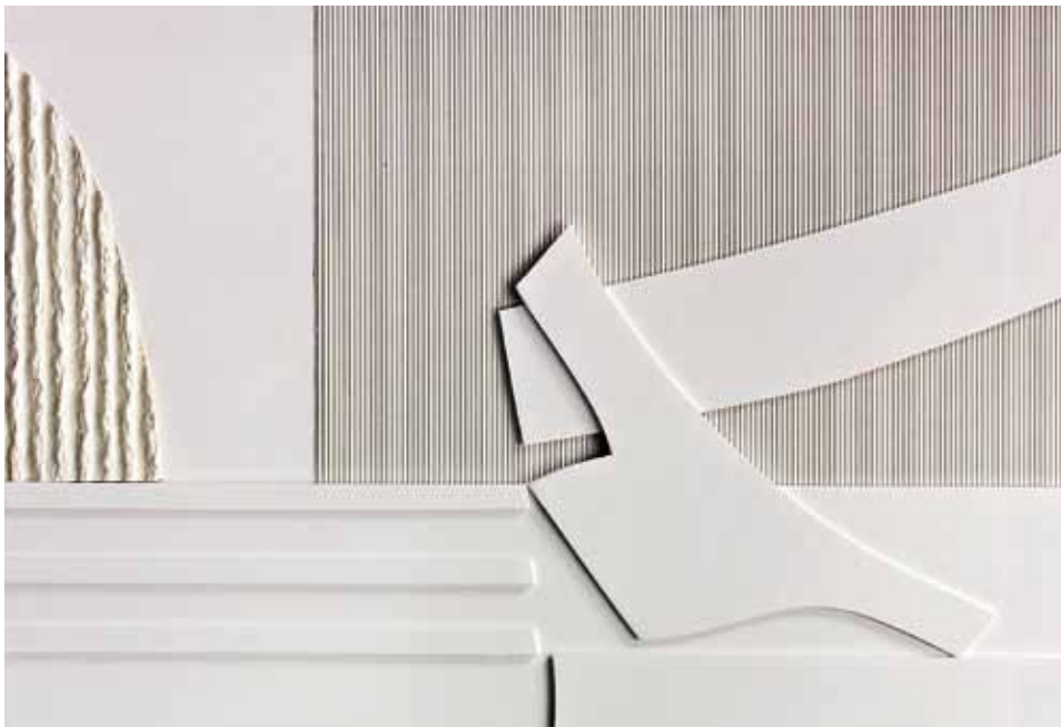
BIANCHI TERRITORI. (DETALLE) Pannello scultura. Carte, carton plume e metacrilato. 100 x 70 cms.