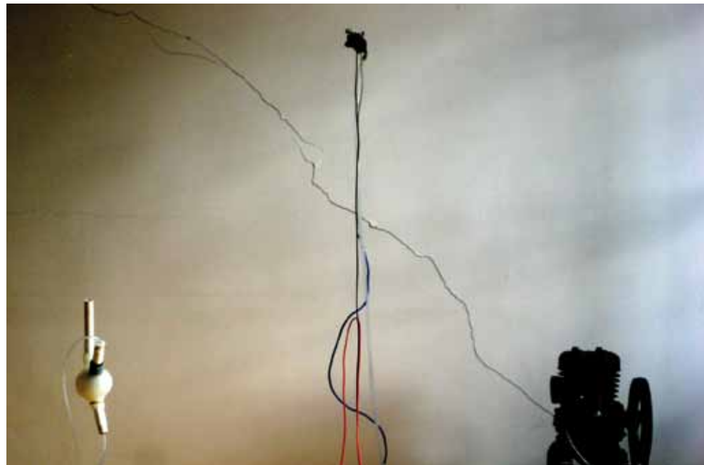
CUIDADOS INTENSIVOS. Proyección videográfica de un evento performativo.